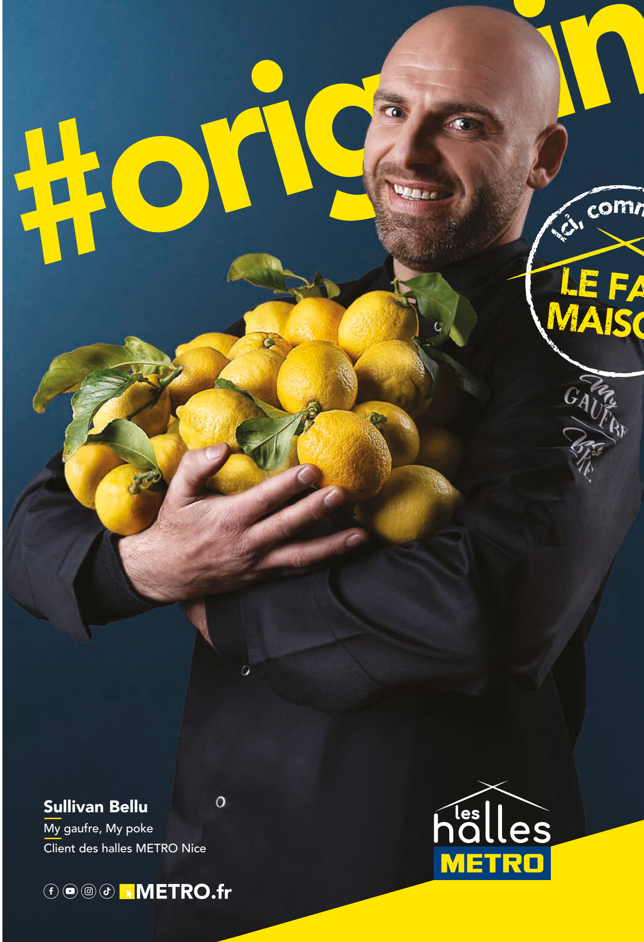
Sullivan Bellu My gaufre, My poke Client des halles METRO Nice