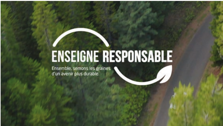
1/ Le logo [ENSEIGNE RESPONSABLE] apparaît