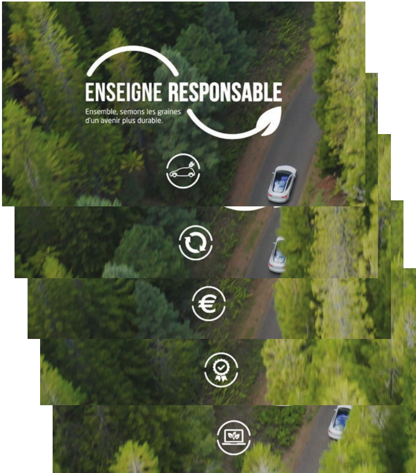
2/ Les pictos des 5 argumentations se succèdent sous le logo [ENSEIGNE RESPONSABLE]