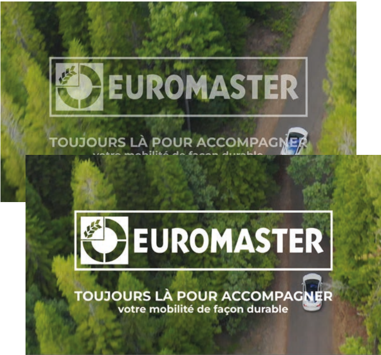
3/ ... laissant place au logo final [EUROMASTER] et la signature : « Toujours là vous accompagner votre mobilité de façon durable »