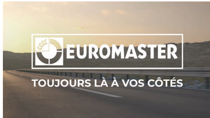
1/ Le Logo Euromaster avec sa signature : Toujours là à vos côtés