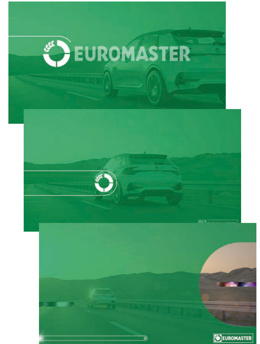
3/ Le sigle revient avec la disparition de la signature Le naming [EUROMASTER] disparaît à son tour