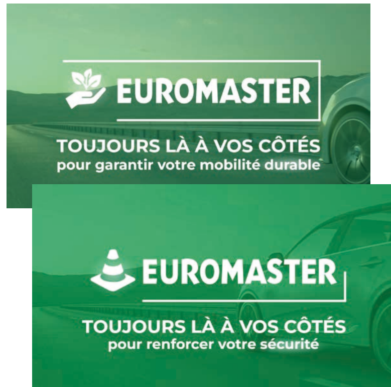
2/ Le Logo Euromaster commence à se déconstruire La signature est complétée par des notions de mobilité durable et de sécurité... ... avec des pictos RSE et sécurité à l'appui