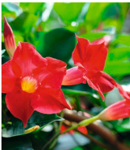
DIPLADÉNIA & EUPHORBE*

Association de deux plantes résistantes à la sécheresse. Floraison longue durée, assurant une composition colorée pendant plusieurs mois. La coupe de 23 cm.