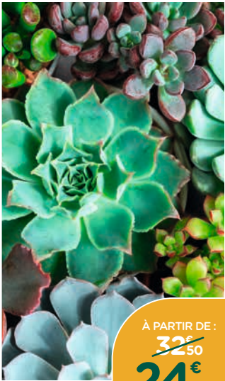
SÉLECTION DE PLANTES SUCCULENTES*

Plantes économes en eau. Nécessitent très peu d'entretien. Résistants à la sécheresse. Coupe Basalt'up de 25 cm.