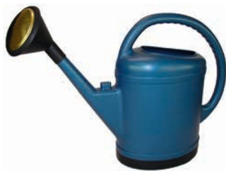
ARROSOIR OVALE EXTRA FORT BELLI

Vendu seul : 16 50 Vendu par 3 : 11 99 € l'unité