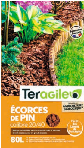
Teragile ÉCORCES DE PIN MARITIME

Le sac de 80 L. Calibre 22/40 mm. Utilisable en agriculture biologique. Empêchent la pousse des mauvaises herbes. Protègent du gel et de la chaleur. À l'unité 16,50 € soit 0,21 € le L. Les 3 : 33 € au lieu de 49,50 € soit 0,14 € le L. Existe aussi en format 100 L à 19,99 € l'unité et 39,98 € les 3, au lieu de 59,97 €. Dans la limite des 4500 unités de disponible.