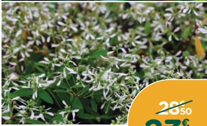
DIPLADÉNIA & EUPHORBE*

Association de deux plantes résistantes à la sécheresse. Floraison longue durée, assurant une composition colorée pendant plusieurs mois. La coupe de 23 cm.