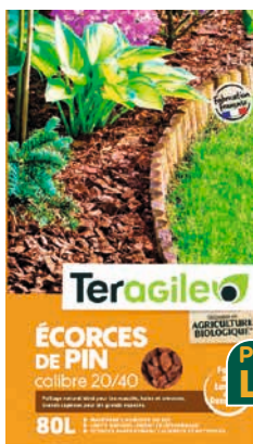
Teragile ÉCORCES DE PIN MARITIME

Le sac de 80 L. Calibre 22/40 mm. Utilisable en agriculture biologique. Empêchent la pousse des mauvaises herbes. Protègent du gel et de la chaleur. À l'unité 16,50 € soit 0,21 € le L. Les 3 : 33 € au lieu de 49,50 € soit 0,14 € le L. Existe aussi en format 100 L à 19,99 € l'unité et 39,98 € les 3, au lieu de 59,97 €. Dans la limite des 4500 unités de disponible.