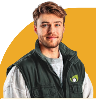
JULES Conseiller Terroir

Découvrez notre sélection 100% origine locale, cultivée tout près de chez vous par des producteurs passionnés. Des végétaux, des saveurs du terroirs, tout a été choisi pour sa qualité, sa fraîcheur... et sa proximité.