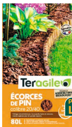
Teragile ÉCORCES DE PIN MARITIME

Le sac de 80 L. Calibre 22/40 mm. Utilisable en agriculture biologique. Empêchent la pousse des mauvaises herbes. Protègent du gel et de la chaleur. À l'unité 16,50 € soit 0,21 € le L. Les 3 : 33 € au lieu de 49,50 € soit 0,14 € le L. Existe aussi en format 100 L à 19,99 € l'unité et 39,98 € les 3, au lieu de 59,97 €. Dans la limite des 4500 unités de disponible.