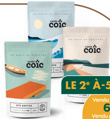
SÉLECTION DE CAFÉS MOULUS CAFÉS COÏC*

Vendu seul : 4 €95 Vendu par 2 : 3 € 96 L'unité