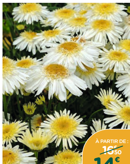
SÉLECTION DE VIVACES*

Sélection de penstemon , leucanthemum ou echinacea fleuris. Jolies plantes, pratiques et sans contraintes d'entretien. Le pot de 4 L.