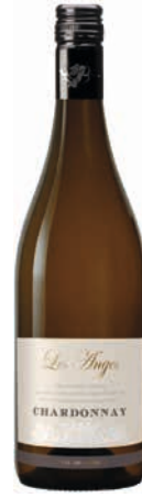
VIN BLANC CHARDONNAY LES ANGES 75 CL

Vendu seul : 6 €99 Vendu par 6 : 4 € 66 L'unité