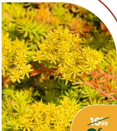
SÉLECTION DE SÉDUMS*

Apportent une touche naturelle et graphique au jardin. Floraison de juin à octobre selon l'espèce. Résistants à la sécheresse. Le pot de 4 L.