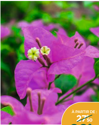
BOUGAINVILLIER VIOLET DE MÈZE*

Hauteur 90/120 cm. Floraison abondante. Idéal pour apporter de la couleur aux façades, pergolas, treillis et balcons. Le pot de 3 L.