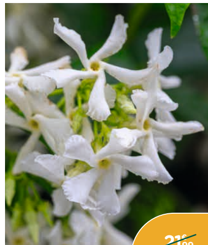
JASMIN ÉTOILÉ TRACHELOSPERMUM JASMINOIDES*

Support tipi de 60 à 90 cm. Attire les pollinisateurs tout en restant peu sensible aux maladies. Le contenant de 3 L.