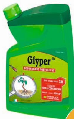
DÉSHERBANT POLYVALENT CONCENTRÉ GLYPER

Vendu seul : 16 50 Vendu par 3 : 11 99 € l'unité