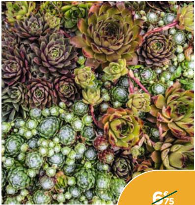
SÉLECTION DE SÉDUMS ET SEMPERVIVUMS*

Faciles d'entretien et résistants à la sécheresse. Magnifique mélange de feuillages graphiques et de textures variées. Le pot de 1 L.