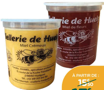
MIEL DE LA MIELLERIE DE HUELGOAT 1 KG

Texture liquide ou crémeuse. Miel pur et sans produits chimiques, récolté dans des conditions respectueuses de l'environnement. Le pot de 1 kg.