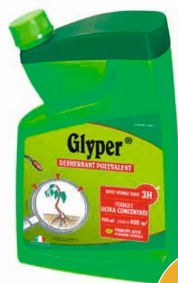
DÉSHERBANT POLYVALENT CONCENTRÉ GLYPER

Vendu seul : 16 50 Vendu par 3 : 11 99 l'unité