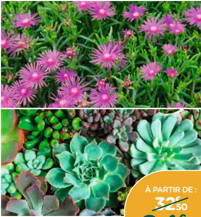
SÉLECTION DE PLANTES SUCCULENTES*

Plantes économes en eau. Nécessitent très peu d'entretien. Résistants à la sécheresse. Coupe Basalt'up de 25 cm.