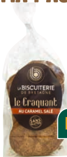
LES CRAQUANTS CARAMEL AU BEURRE SALÉ BISCUITERIE DE BRETAGNE 100 G

Biscuits croquants bretons à base d'amande et de sucre. Existents aussi en nature et aux pommes. Disponible également en 220 g à des prix différents. Élaborés de façon artisanale avec des ingrédients naturels de qualité supérieure. À l'unité 4,95 € soit 49,50 € le kg. Les 2 : à partir de 7,92 € au lieu de 9,90 € soit 39,60 € le kg. Le paquet de 100 g ou 220 g.