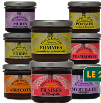
SÉLECTION DE CONFITURES BREIZH KONFITUR*

Vendu seul : 6 €99 Vendu par 6 : 5 € 83 L'unité