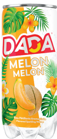
BOISSON AROMATISÉE Réf. : 288289 DADA melon la boîte 33cl