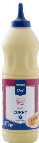
SAUCE CURRY Réf. : 232124 METRO CHEF le squizz 870g