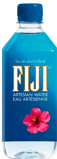
EAU PLATE Réf. : 282667 FIJI la bouteille 50cl P.E.T.