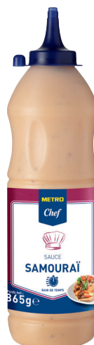
SAUCE SAMOURAÏ Réf. : 204773 METRO CHEF le squizz 865g