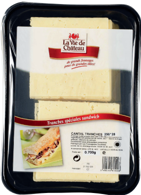
CANTAL Réf. : 160173 LA VIE DE CHÂTEAU tranches 25g la barquette 700g