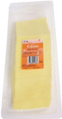
ÉDAM Réf. : 000028 tranchettes "spéciales baguettes, sandwichs et croques" la barquette 1kg