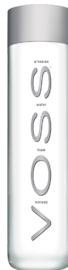
EAU PLATE Réf. : 269684 VOSS la bouteille 50cl P.E.T.