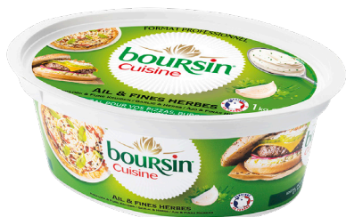
TARTINABLE BOURSIN AIL ET FINES HERBES Réf. : 040285 la barquette 1kg