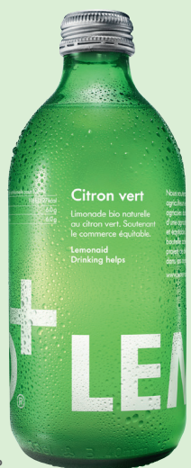
LIMONADE CITRON VERT Réf. : 277372 LEMONAID bio la bouteille 33cl V.P.