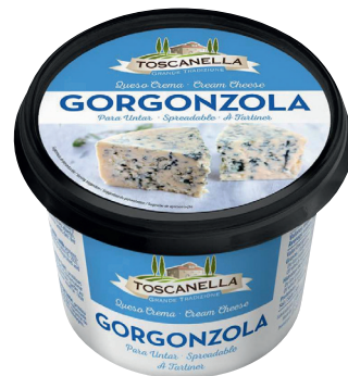
CRÈME DE GORGONZOLA Réf. : 271776 TOSCANELLA le pot de 500g