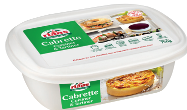
TARTINABLE CHÈVRE CABRETTE Réf. : 263486 RIANS la barquette 750g