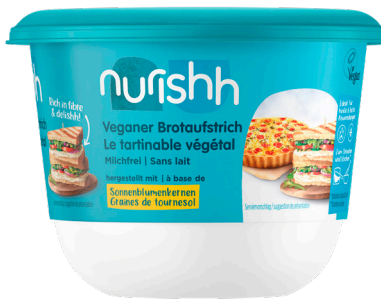
TARTINABLE VÉGÉTAL Réf. : 293798 NURISHH convient aux végans pot de 227g le xx