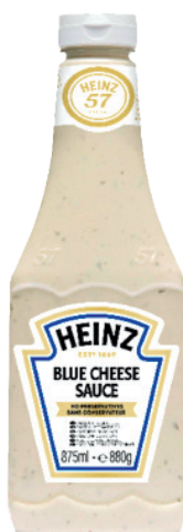
SAUCE BLUE CHEESE Réf. : 254171 HEINZ le flacon 875ml