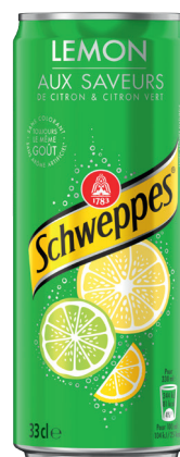
SODA Réf. : 201566 SCHWEPES lemon la boîte 33cl