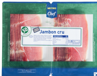
JAMBON CRU Réf. : 061538 METRO CHEF format sandwich 50 tranches la barquette 2x250g