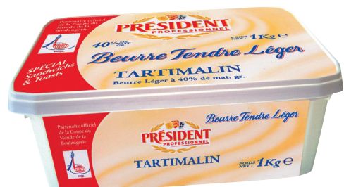
TARTIMALIN Réf. : 063889 PRÉSIDENT PROFESSIONNEL beurre tendre demi-sel léger 40% M.G. spécial sandwiches & toasts la barquette 1kg