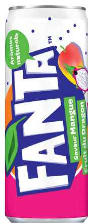
SODA Réf. : 246171 FANTA mangue/fruit du dragon la boîte 33cl