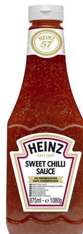
SAUCE SWEET CHILLI Réf. : 254191 HEINZ le flacon 875ml