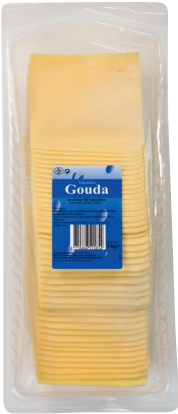
GOUDA Réf. : 000056 tranchettes "spéciales baguettes, sandwichs et croques" la barquette 1kg