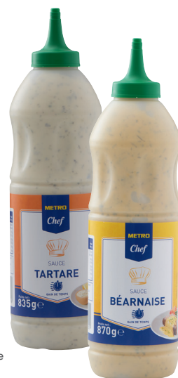
SAUCE Réf. : 236637, Réf. : 236638 METRO CHEF béarnaise ou tartare le squizz 870g