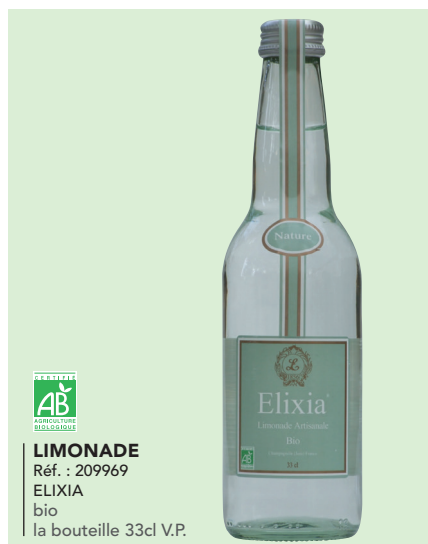
LIMONADE Réf. : 209969 ELIXIA bio la bouteille 33cl V.P.