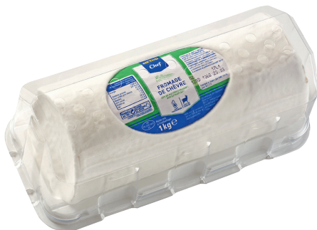
FROMAGE DE CHÈVRE Réf. : 085442 METRO CHEF sous coque la bûche de 1kg