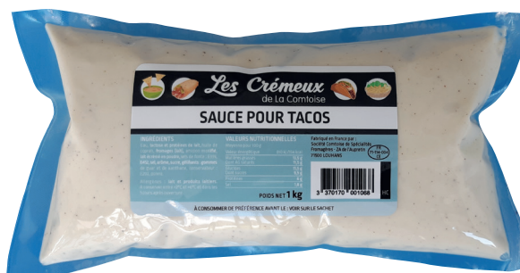
SAUCE POUR TACOS Réf. : 264892 LA COMTOISE la poche 1kg