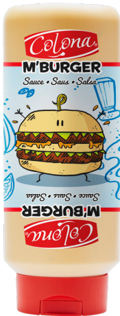
SAUCE M'BURGER Réf. : 297484 COLONA le squizz 800ml