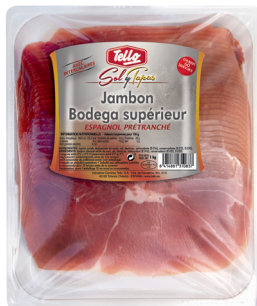
JAMBON SEC SUPÉRIEUR ESPAGNOL "BODEGA" ORIGINE ESPAGNE Réf. : 189098 TELLO 60 tranches environ la barquette 1kg