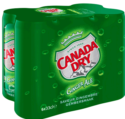
SODA AU GINGEMBE Réf. : 297706 CANADA DRY la boîte 33cl