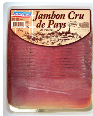
JAMBON CRU DE PAYS Réf. : 028422 FRANCE D'OLONA 20 tranches la barquette 500g