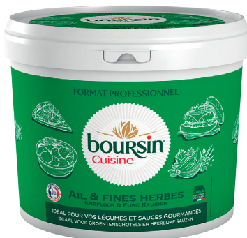
TARTINABLE BOURSIN AIL ET FINES HERBES Réf. : 260152 BOURSIN le pot de 5kg