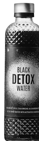
EAU ENRICHIE AU CHARBON ACTIF Réf. : 282342 BLACK DETOX la bouteille 33cl V.P.