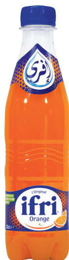
ORANGE Réf. : 266034 IFRI la bouteille 33cl P.E.T.