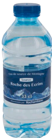
ROCHE DES ÉCRINS Réf. : 202133 eau plate la bouteille 33cl