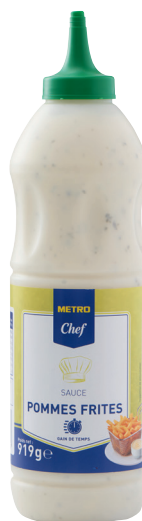
SAUCE POMMES FRITES Réf. : 232127 METRO CHEF le squizz 919g