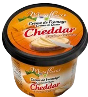
CRÈME CHEDDAR 500G Réf. : 239908 le xx