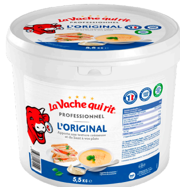
LA VACHE QUI RIT Réf. : 071209 seau 5,5kg