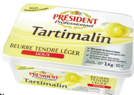
TARTIMALIN Réf. : 008417 PRÉSIDENT PROFESSIONNEL beurre tendre léger 40% M.G. spécial sandwiches & canapés la barquette 1kg