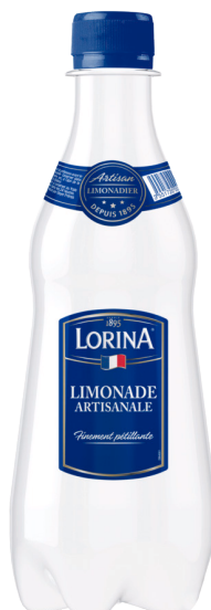
LIMONADE Réf. : 202219 LORINA la bouteille 42cl P.E.T.