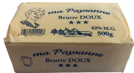
BEURRE DOUX Réf. : 225210 MA PAYSANNE la plaque 500g