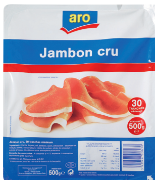
JAMBON CRU Réf. : 070988 ARO la barquette 500g