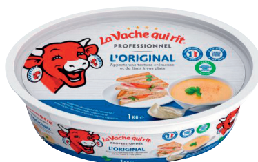
LA VACHE QUI RIT Réf. : 008737 LA VACHE QUI RIT la barquette 1kg