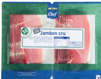
JAMBON CRU Réf. : 061538 METRO CHEF format sandwich 50 tranches la barquette 2x250g