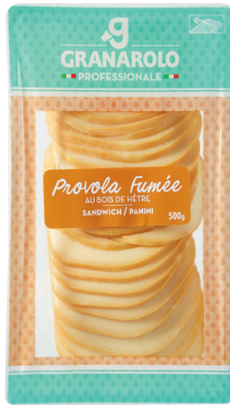
PROVOLA FUMÉE Réf. : 245883 GRANAROLO la barquette 500g