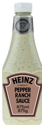
SAUCE CREAMY BLACK PEPPER RANCH Réf. : 187774 HEINZ le flacon souple 875ml