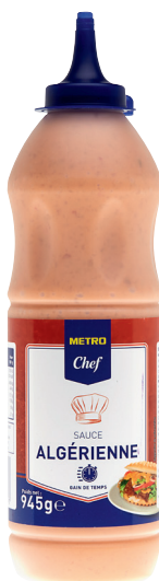
SAUCE ALGÉRIENNE Réf. : 204761 METRO CHEF le squeezez 945g