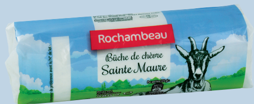
la marque METRO CHÈVRE LONG Réf. : 236306 ROCHAMBEAU la pièce 200g