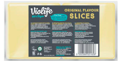
TRANCHES VEGAN SAVEUR EMMENTAL Réf. : 267349 le sachet 500g