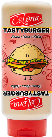
SAUCE TASTYBURGER Réf. : 297563 COLONA le squizz 800ml