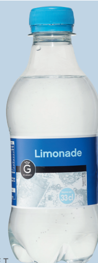
la marque METRO LIMONADE Réf. : 270540 GILBERT la bouteille 33cl P.E.T.