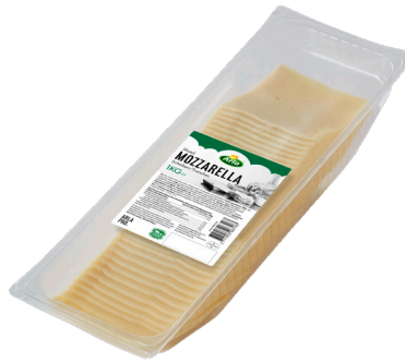
MOZZARELLA TRANCHES 9*9 Réf. : 246492 ARLAPRO le xx