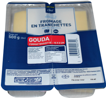
GOUDA Réf. : 081692 METRO CHEF 30 tranchettes "spécial baguettes" la barquette 2x250g