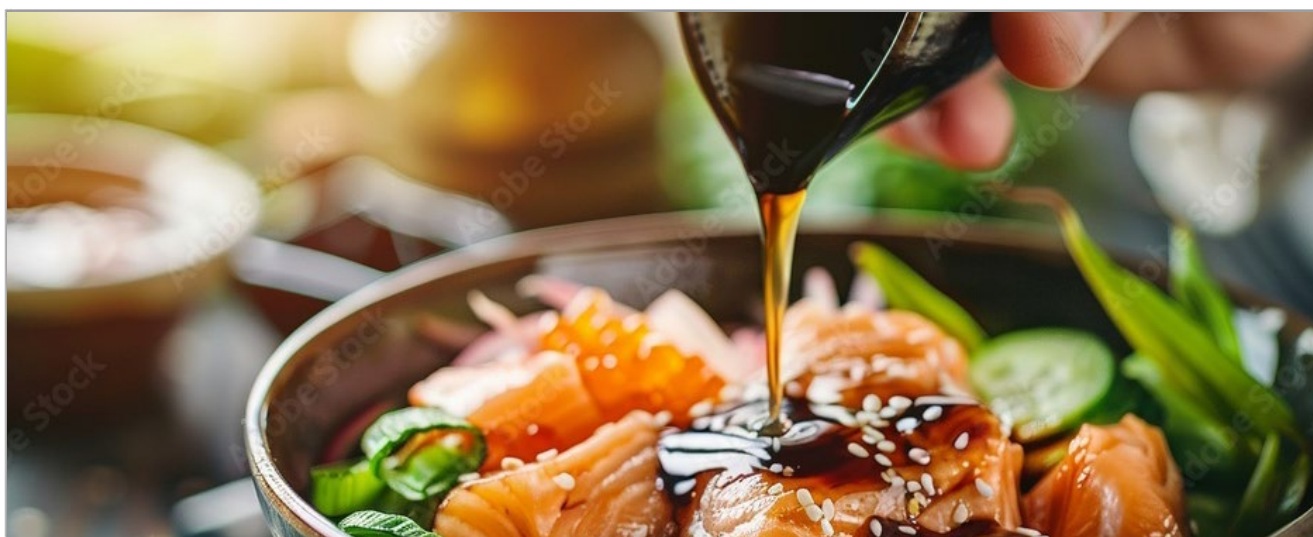
PÂTE MISO ROUGE HIKARI MISO Réf. : 149753 la barquette 300g