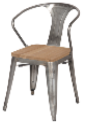
FAUTEUIL MONACO ASSISE TECK