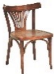
CHAISE PALMA FRENCH PATINA