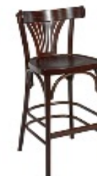
CHAISE HAUTE PALMA NOYER