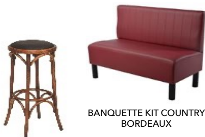
BANQUETTE KIT COUNTRY BORDEAUX