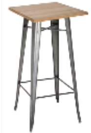
MANGE DEBOUT MONACO PLATO TECK