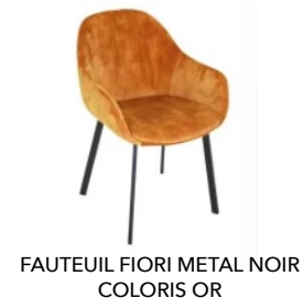
FAUTEUIL FIORI METAL NOIR COLORIS OR