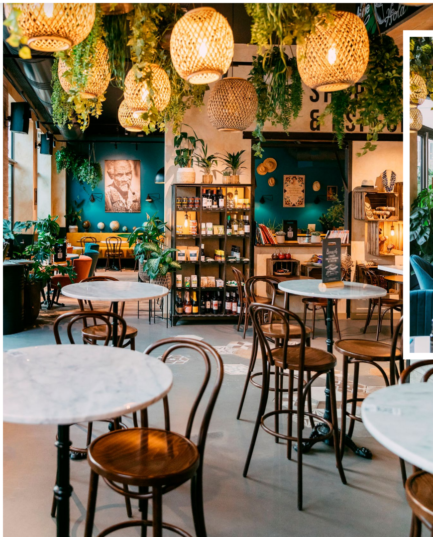
S'INSPIRER DE CETTE COMPOSITION