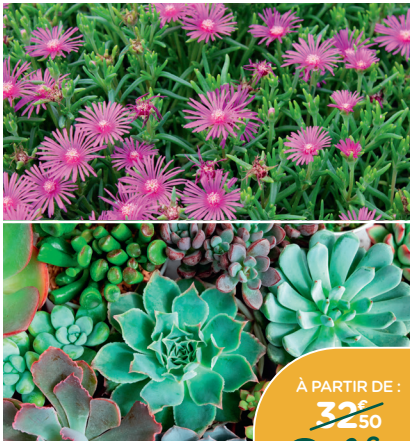
SÉLECTION DE PLANTES SUCCULENTES*

Plantes économes en eau. Nécessitent très peu d'entretien. Résistants à la sécheresse. Coupe Basalt'up de 25 cm.