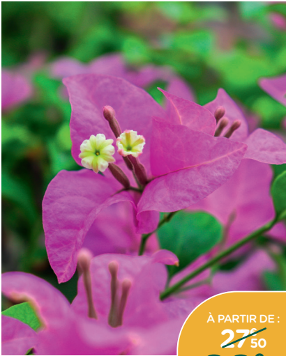
BOUGAINVILLIER VIOLET DE MÈZE*

Hauteur 90/120 cm. Floraison abondante. Idéal pour apporter de la couleur aux façades, pergolas, treillis et balcons. Le pot de 3 L.