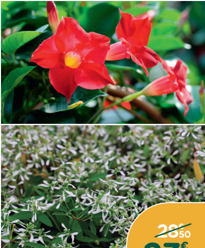
DIPLADÉNIA & EUPHORBE*

Association de deux plantes résistantes à la sécheresse. Floraison longue durée, assurant une composition colorée pendant plusieurs mois. La coupe de 23 cm.