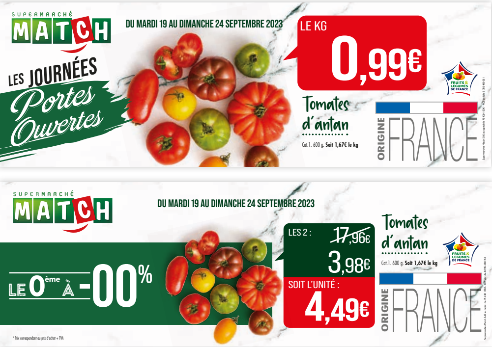
Calicot : le logo JPO disparaît quand il y a une promo