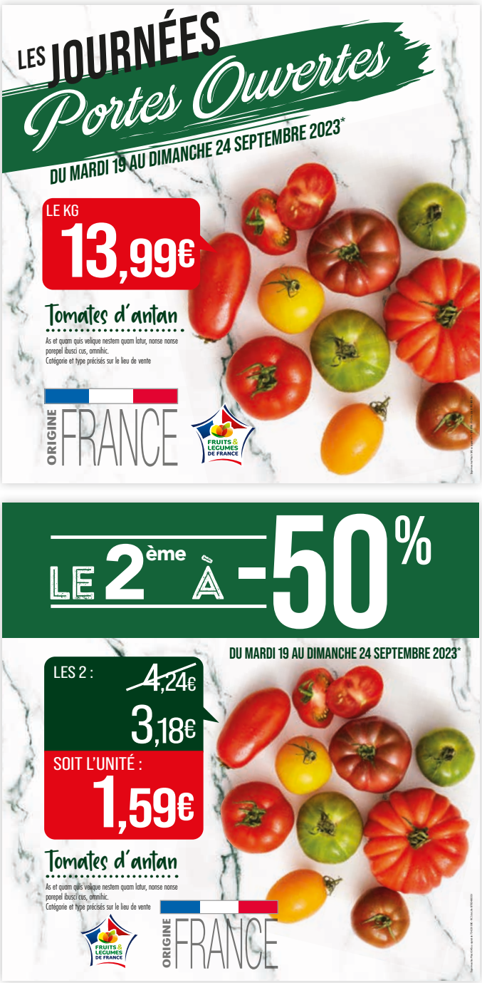
Totem : le logo JPO disparaît quand il y a une promo