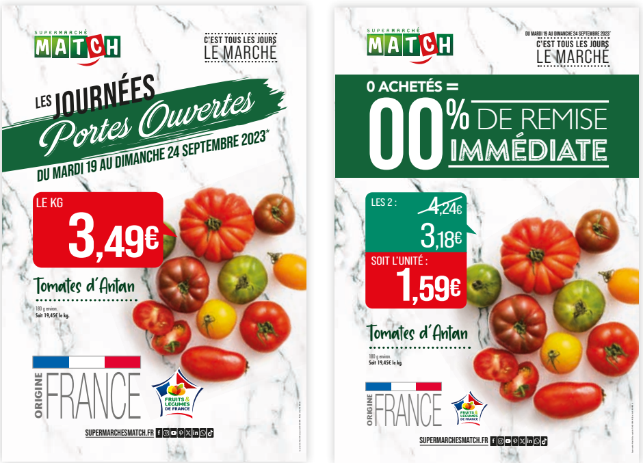
Roseau : le logo JPO disparaît quand il y a une promo