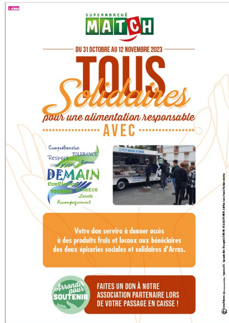
PLV X37 associations